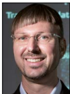
Dirk Helbing (Computational Social Science, ETH Zürich)